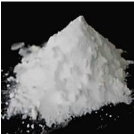
Abb. 4: Arsenik (Pulver)

Arsenik oder Arsen trioxid, As_2O_3 ist sehr stark giftig. Die letale Dosis beträgt DL_{50} 1,4 mg/kg 8 . Das bedeutet, dass ein Mann mit dem Gewicht von 75 kg nach einer Gabe von 105 mg Arsenik sterben würde. Auch für Tiere und Pflanzen ist Arsenik tödlich. Es ist zudem krebserzeugend und stark wassergefährdend. Als Gift kennt man Arsenik schon seit dem Altertum. Anfang des 20. Jahrhunderts setzte man eine organische Arsenverbindung unter dem Namen Salvarsan gegen die Syphilis ein.