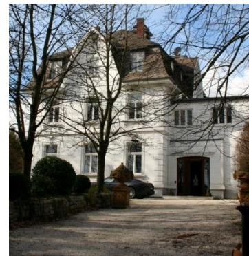
Abb. 1: die Villa Schimmelbusch