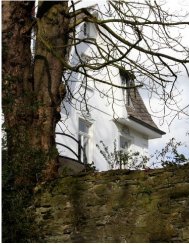
Abb.2: die Original Mauer auf der Rückseite

Nach der behördlichen Anordnung musste er sein Grundstück mit einer hohen Mauer umgeben.