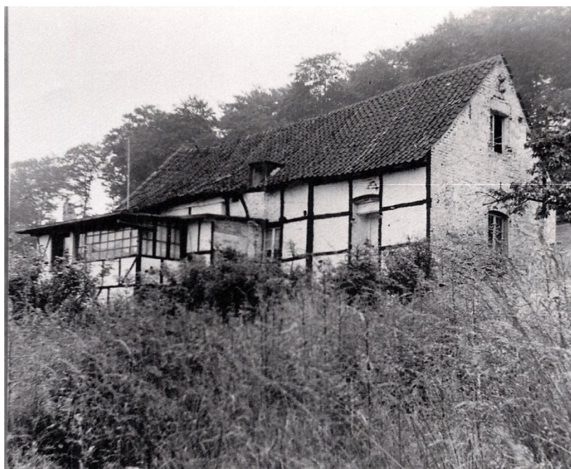
Abbildung 4: Schloß Pirleont, Nordseite, undatiert, vermtl. vor 1950.