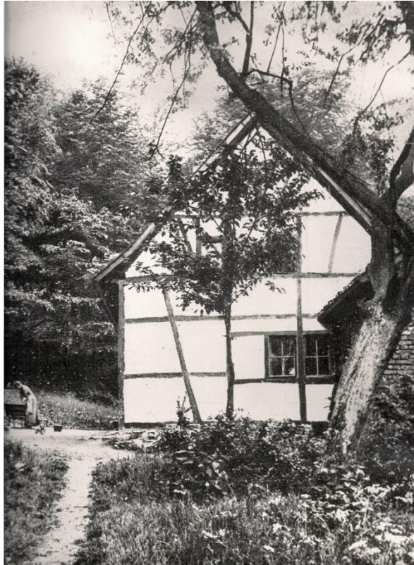
Abbildung 5: Schloß Pirlepont, Ostgiebel. Fotograf Dr. Erwin Quedenfeld, 1911. StA Erkrath.